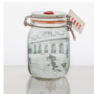
Album- ricordi in conserva